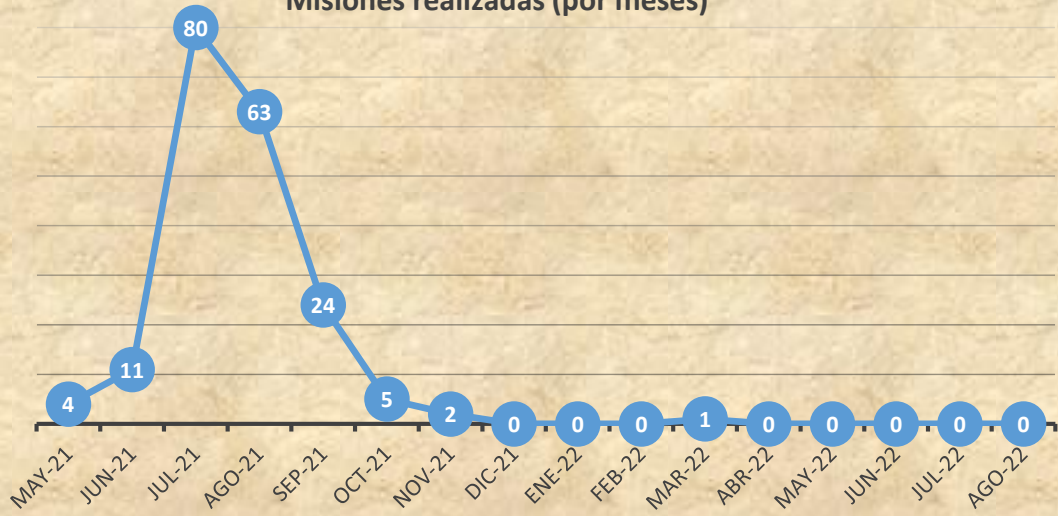
Misiones realizadas (por meses)